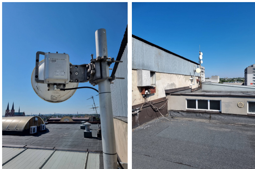
Widok obiektu wraz z zainstalowanym zespołem antenowym