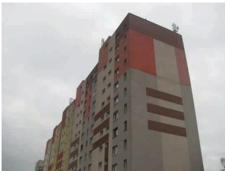
Zał. nr 1: Widok ogólny instalacji radiokomunikacyjnej.

Koniec sprawozdania. Sprawozdanie zawiera dodatkowo załączniki nr 1 i 2.