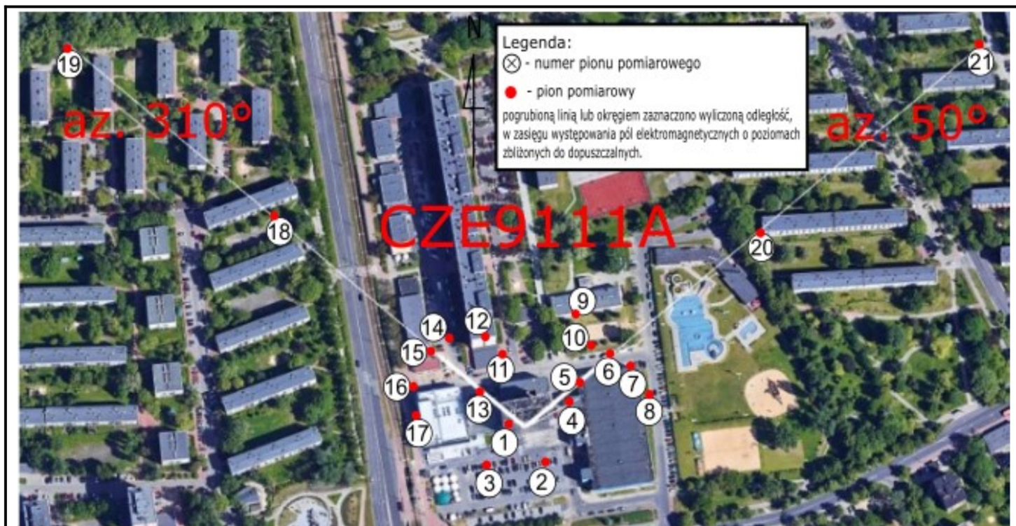
Zdjęcie satelitarne: Image © 2024 Google