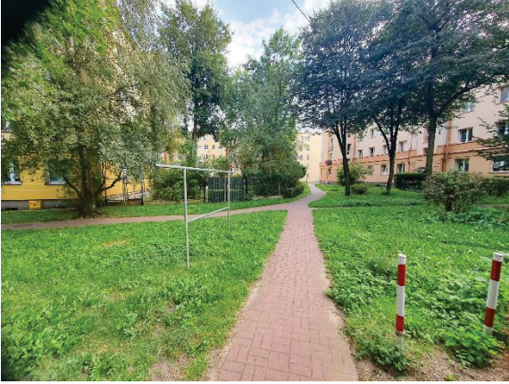
Zdj. 1 i 2

Wiceprzewodniczący Komisji Kultury, Sportu i Turystyki