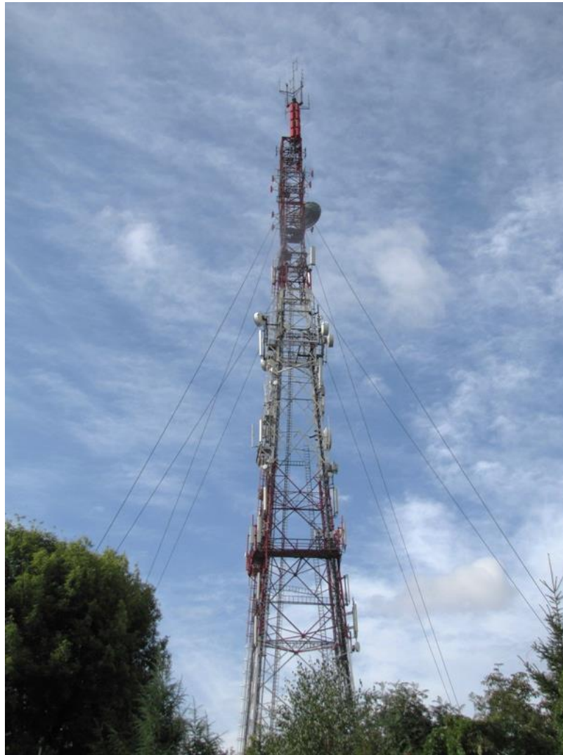
Fot. 1. TON Częstochowa / Bleszno – widok obiektu