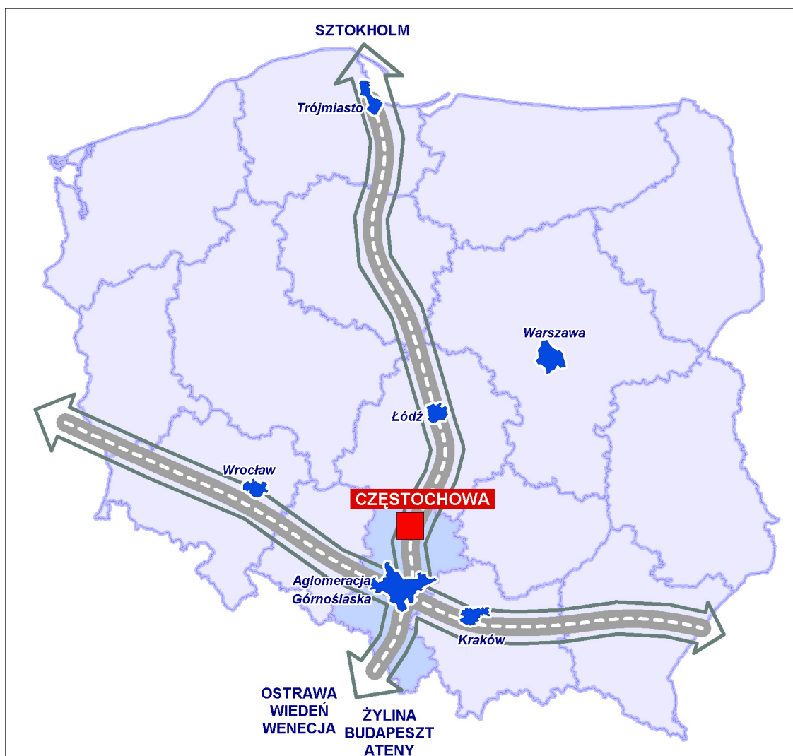
Rysunek 1. Położenie Częstochowy

Według Planu Zagospodarowania Przestrzennego Województwa Śląskiego, wokół tego korytarza wyznaczone zostało pasmo przyspieszonego rozwoju.