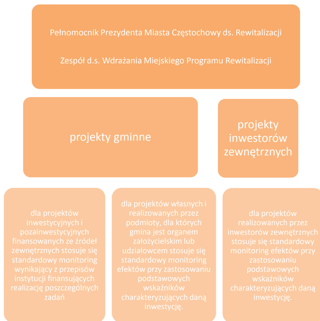
Tablica 3 System monitoringu Miejskiego Programu Rewitalizacji

W celu sprawnego i efektywnego wdrażania Programu Rewitalizacji Miasta, stosowane będzie standardowe monitorowanie realizowanych projektów [zarówno inwestycyjnych, jak i pozainwestycyjnych], wynikające z przepisów prawa oraz wytycznych instytucji finansujących, bądź też wspierających finansowanie, czy też realizację poszczególnych projektów.