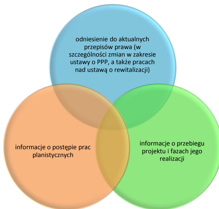
Tablica 4 Zakres działań promocyjnych przewidzianych w ramach MPR

Działania promocyjne w ramach programu będą prowadzone przy użyciu narzędzi, przedstawionych na poniższym schemacie: