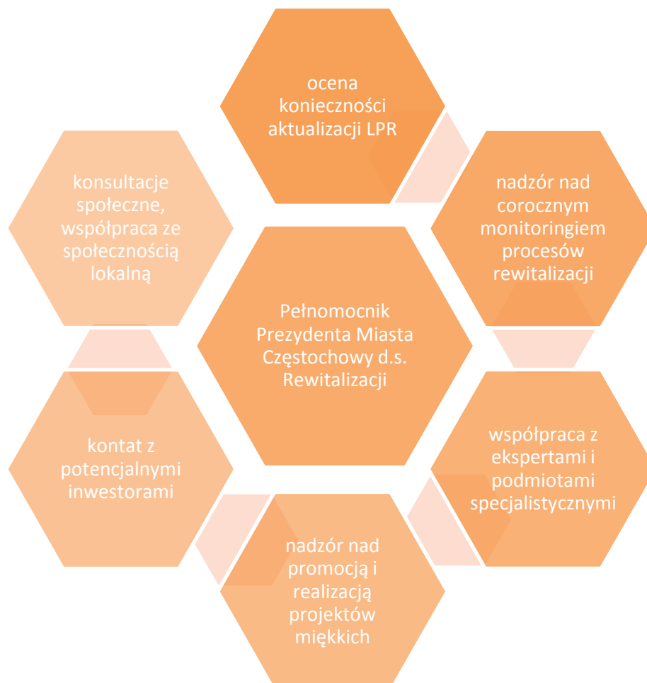
Tablica 2 Zakres odpowiedzialności Pełnomocnika Prezydenta Miasta Częstochowy d.s. Rewitalizacji

Za koordynację działań ujętych w MPR, monitoring rezultatów MPR i aktualizację programu odpowiada Pełnomocnik Prezydenta Miasta Częstochowy do spraw Rewitalizacji.