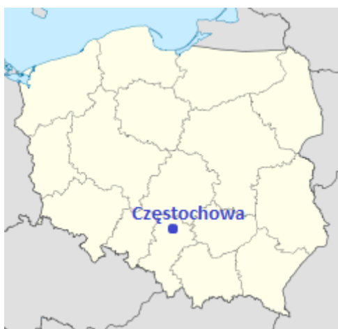
Częstochowa na mapie Polski