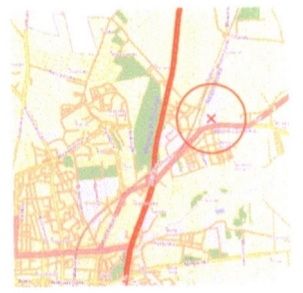
ORIENTACJA lokalizacja terenu inwestycji SKALA 1 : 50 000