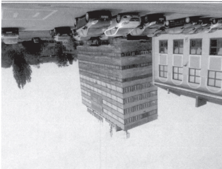
Zak. nr 1: Widok ogólny instalacji radiokomunikacyjnej.