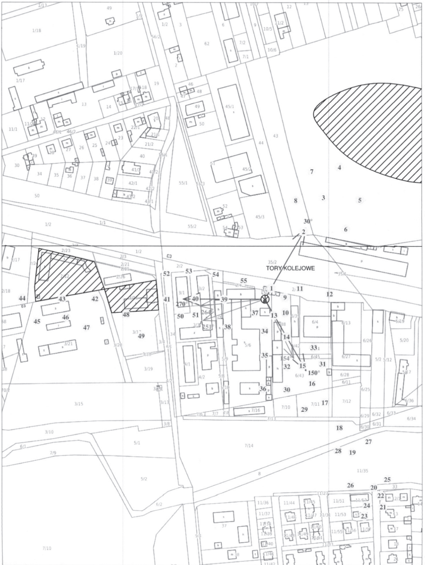
Rys. 2 Lokalizacja pionów pomiarowych

Legenda: brak dostępu antena radiolinowa źródło PEM antena sektorowa nr pion pomiarowy