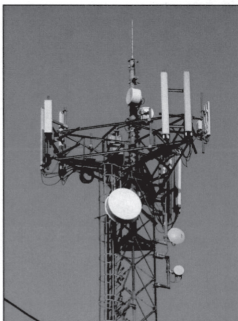
Rys. 3 Widok badanego obiektu