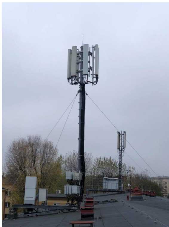
Zał. nr 1: Widok ogólny instalacji radiokomunikacyjnej.